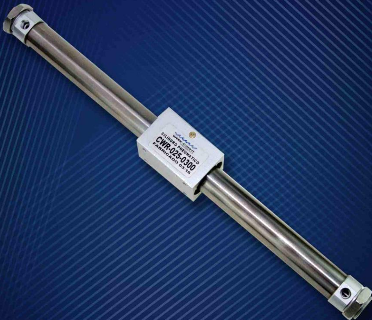
Cilindro sem Haste de Acoplamento Magnético Série CWR